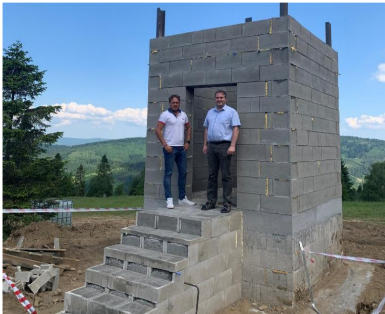
Telo novej rozhľadne v Oščadnici rastie ako z vody.

V Oščadnici vyrastie nová rozhľadňa. Jej výstavba je výsledkom spolupráce obce a Oblastnej organizácie cestovného ruchu Kysuce (OOCR Kysuce)