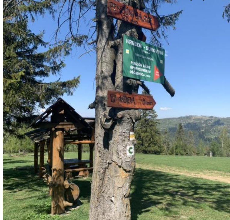
Rozhľadňa sa stane dominantou náučného chodníka na hrebeňovej trase.