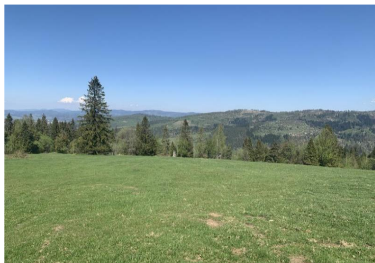
Miesto výstavby poskytuje výhľady na panorámu Javorníkov a oblasť Horných Kysúc.

„S potešením vítame aktivity RD Velká Rača. Podporujeme lokálnych výrobcov a to nie len s ohľadom na rozvoj cestovného ruchu, ale tiež